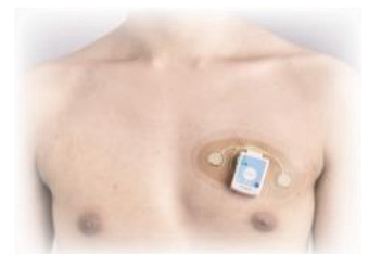
記録器と電極(1ch)の装着イメージ