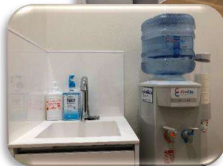
お湯をつかってミルクもつくれます