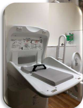
オムツ交換はこちらで